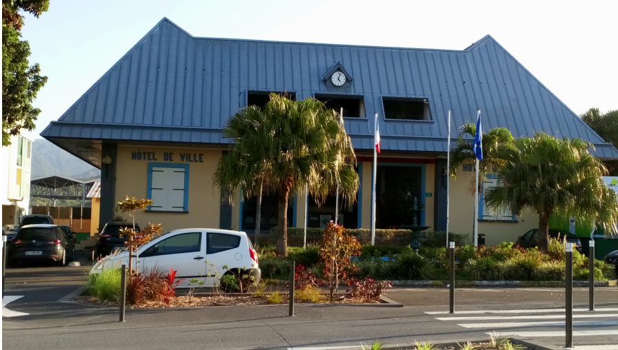
Mairie de Bras-Panon

Bravo monsieur le président du Parc National de La Réunion ! En matière de protection de la biodiversité, on fait mieux !