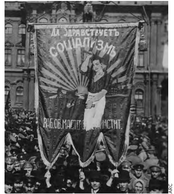
Manifestation d'ouvriers le 1 er mai à Pétrograd.

employés du commerce et de l'industrie, les ouvriers du bâtiment, les bronziers, les peintres, les manœuvres, les cordonniers, les artisans du cartonnage, les ouvriers charcutiers, les menuisiers font grève, successivement, pendant tout le mois de juin. (...) Pour les ouvriers avancés, il devenait de plus en plus clair que des grèves économiques partielles, dans les conditions de la guerre, du désarroi et de l'inflation, ne pouvaient apporter de sérieuses améliorations, qu'il fallait modifier de quelque façon les bases mêmes. Le lock-out n'ouvrait pas seulement l'esprit des ouvriers à la revendication d'un contrôle sur l'industrie, mais les poussait à l'idée de la nécessité de mettre les usines à la disposition de l'État. Cette déduction paraissait d'autant plus naturelle que la plupart des usines privées travaillaient pour la guerre et qu'à côté d'elles il existait des entreprises d'État du même type. (...) »