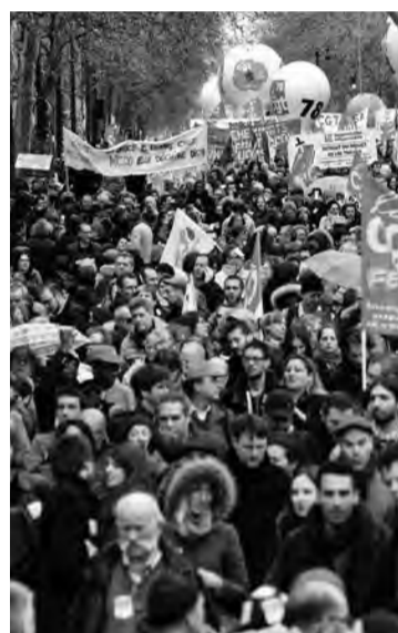
Manifestation contre la loi travail.

Mais le problème de Mélenchon n'est pas tant le vote de bonnes ou de mauvaises lois que son avenir personnel. S'appuyant sur son bon résultat à l'élection présidentielle face à celui du PS, il se voit déjà en leader incontesté d'une