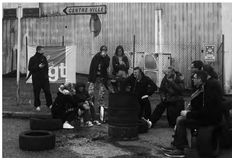
Le piquet de grève.

La colère est bien là, face à une direction qui ne propose que 8 000 euros d'indemnités de licenciement pour les plus jeunes, et une indemnité bloquée à 13 ans d'ancienneté pour les anciens, soit au maximum 24 000 euros. Par ailleurs, la direction aimerait imposer au passage la réorganisation du travail en 5X8 – sans payer les dimanches à 100 % – sous prétexte de