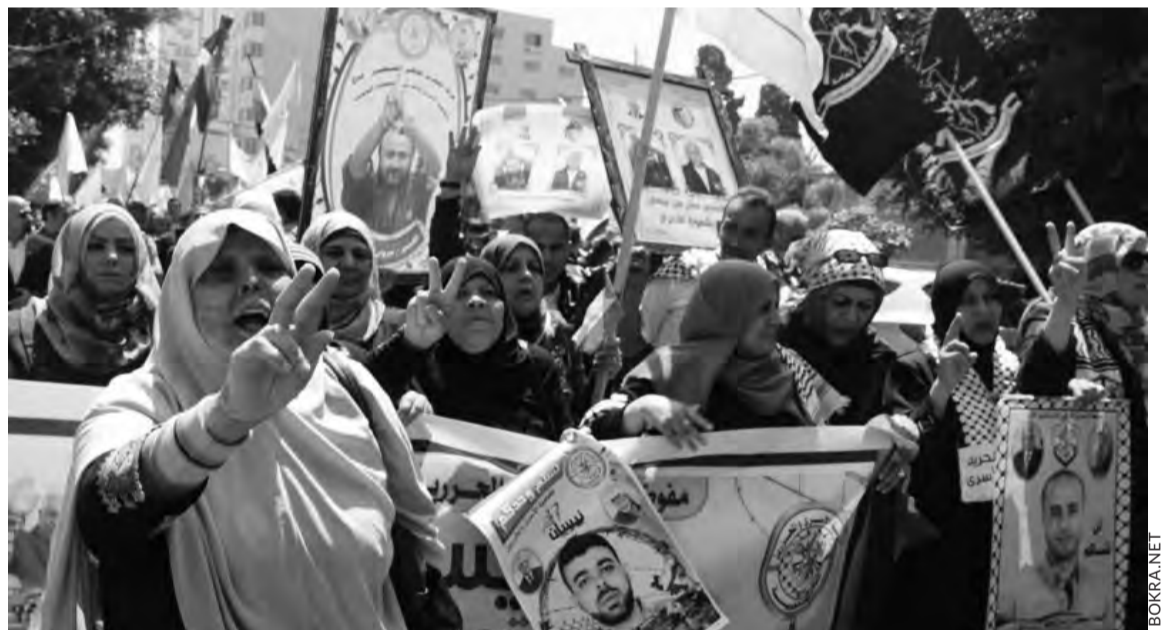
Manifestation de soutien aux prisonniers palestiniens à Ramallah le 17 avril.

Un rassemblement de soutien se tient à Paris, le 24 mai à 18 heures, place de l'Opéra.