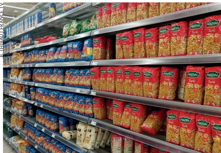
B. THIBAUT FRANCE TV