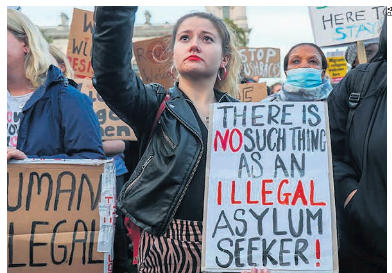
Des manifestants pour l'accueil des demandeurs d'asile à Londres : « un demandeur d'asile clandestin, ça n'existe pas ! ».