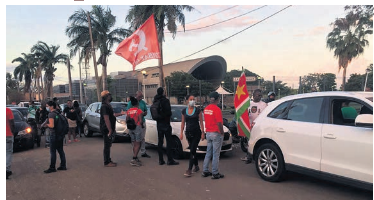
Des manifestants anti-Le Pen bloquent la route de France TV.

de presse tenue à son hôtel avant de quitter l'île, Marine Le Pen a évidemment dénoncé ces manifestants d'extrême gauche et indépendantistes et a déclaré qu'elle porterait plainte.