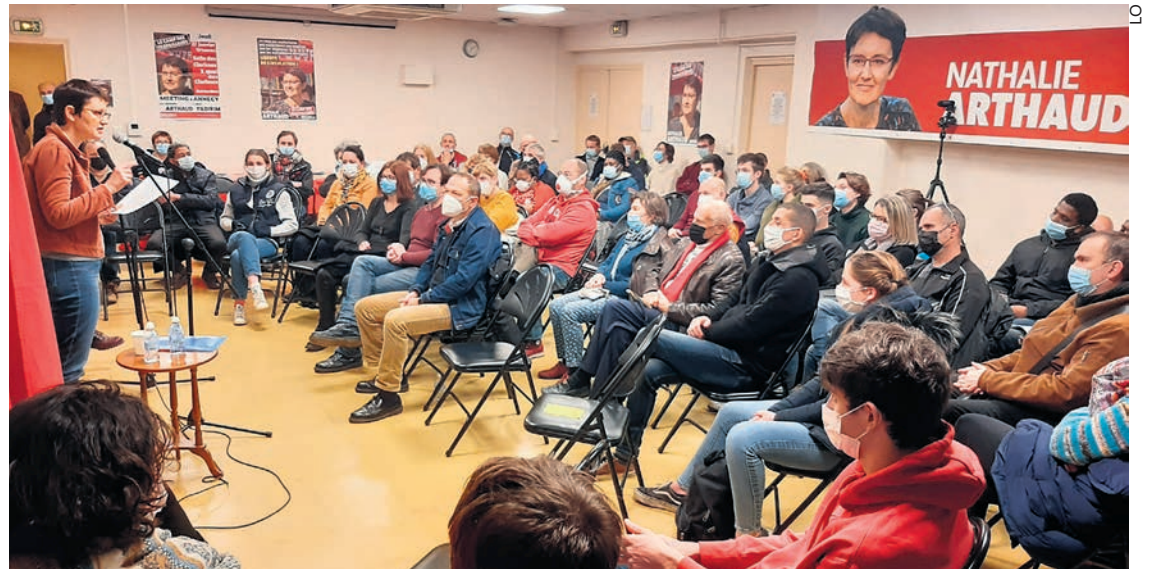
Meeting à Annecy.