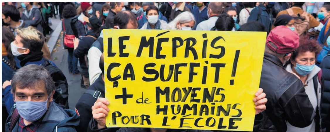
Rassemblement d'enseignants à Paris, le 10 novembre 2020.

Tout cela relève du recyclage d'annonces démagogiques déjà faites sous Sarkozy et peu suivies d'effet. Faute d'enseignants de réserve, dans le primaire, en cas d'absence de leur professeur, les élèves sont souvent répartis