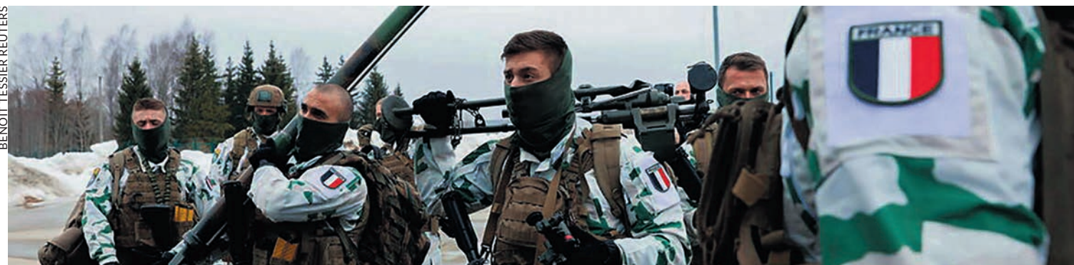
Des soldats français en Estonie pour renforcer les troupes de l'OTAN.