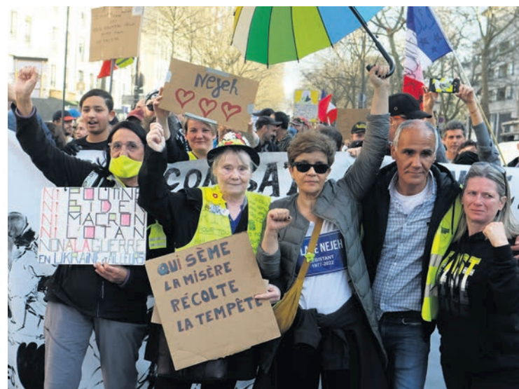
Gilets jaunes en manifestation, samedi 26 mars.