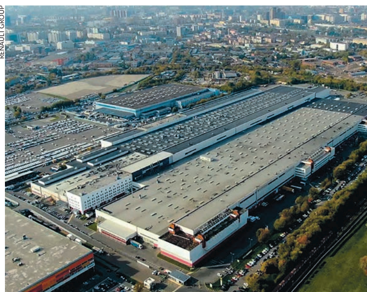
L'usine Renault de Moscou.

Le 23 mars, Renault a annoncé la suspension immédiate de la production de son usine de Moscou et évalue « les options possibles concernant sa participation dans sa filiale Avtovaz ».