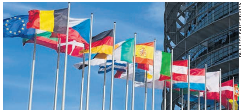
PHILIPPE SAUTIER SIPA

La fixation d'un prix de gros sur le marché européen constitue un autre sujet d'affrontement. Macron a déclaré qu'il fallait déconnecter le prix de gros de l'électricité de celui du gaz naturel, de façon à prendre davantage en compte l'électricité d'origine nucléaire. Une telle modification avantagerait bien sûr la France, qui dispose d'un