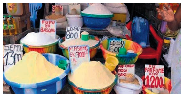
Hausse des prix en République démocratique du Congo.

Augmenter les salaires dans les services publics