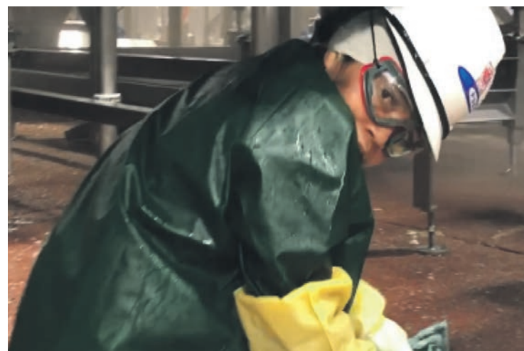
Un des jeunes employés par Packers Sanitation Services.