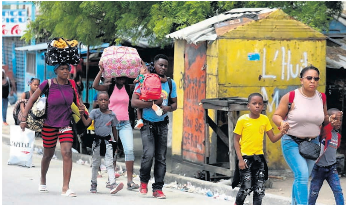
Des habitants de Port-au-Prince fuient leur quartier à cause des affrontements entre gangs.

Mais, depuis, les puissances impérialistes soufflent le chaud et le froid. En