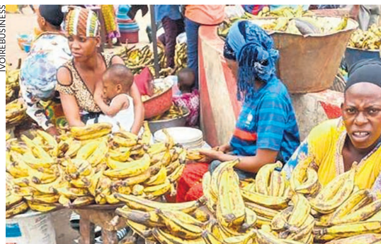
Sur un marché en Côte d'Ivoire.