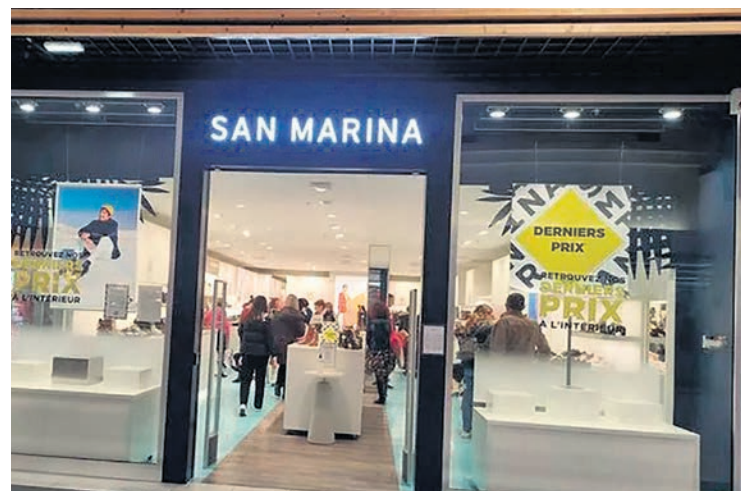
Un magasin du groupe San Marina, après son placement en liquidation judiciaire.

Quant aux travailleurs, ils sont en bout de chaîne et sont ceux qui payent le plus cher. Toutes les hausses de prix se cumulent et se répercutent sur les prix des produits de consommation courante. Et, quand une entreprise fait faillite, ils payent en perdant leur emploi. Mais si, dans la guerre économique, les grands capitalistes sont les plus puissants, dans la lutte de classe, les travailleurs sont ceux qui pourraient tout remettre