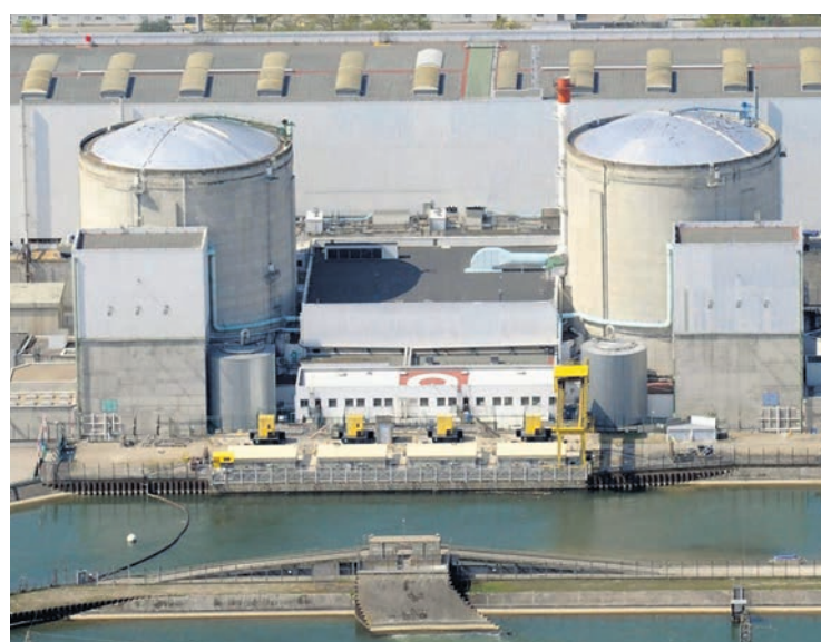
La centrale de Fessenheim.

À la suite de cette décision gouvernementale, le conseil d'administration de