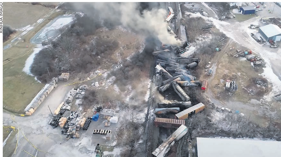
Déraillement du train à East Palestine, Ohio.