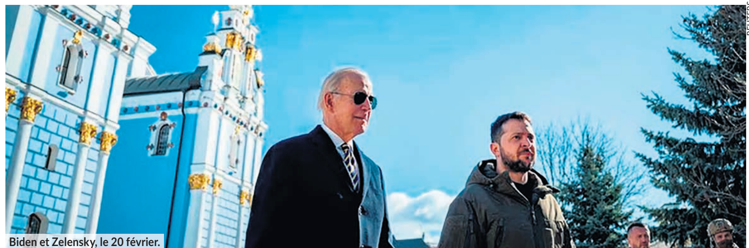
Biden et Zelensky, le 20 février.