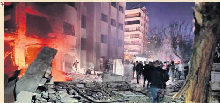
Damas, après le bombardement.

L'aviation israélienne a bombardé le 19 février un quartier résidentiel de Damas, la capitale de la Syrie, faisant quinze morts.