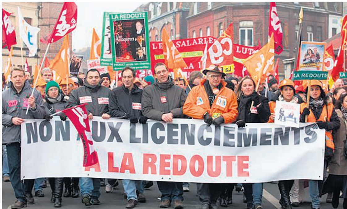
Manifestation contre les licenciements, le 13 décembre 2014.

Cette vente a été finalisée il y a quelques mois. Résultat des courses :