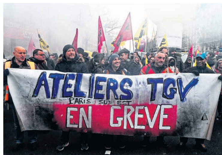
Contre la réforme des retraites, à Paris le 19 janvier.

Un rassemblement a déjà eu lieu le 16 février, jour de la manifestation contre la réforme des retraites, pour montrer qu'ils ne se laisseraient pas