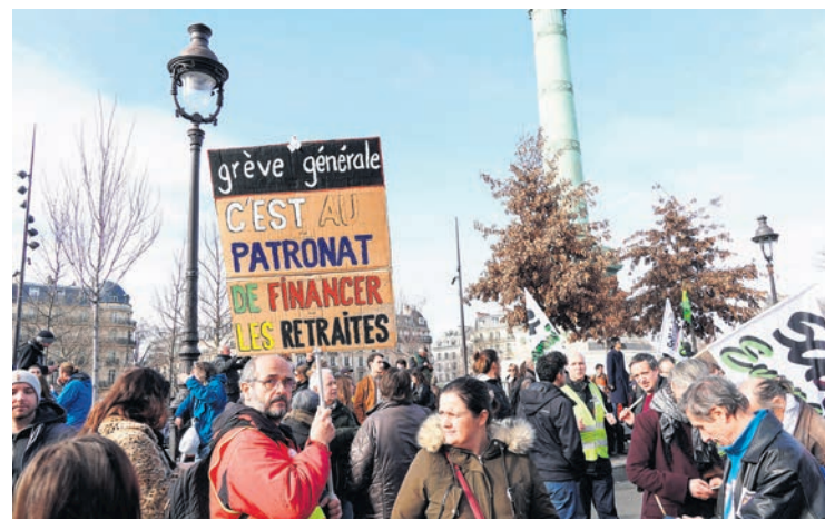
Dans la manifestation parisienne du 16 février.

De nombreux travailleurs reprennent l'idée de « bloquer l'économie », en pensant à des actions spectaculaires de minorités ou en s'en remettant à la grève de quelques secteurs. Face à une attaque générale contre le monde du travail, aucune grève par procuration, menée par une fraction seulement des travailleurs, qu'ils soient dockers, cheminots ou raffineurs, ne peut être victorieuse, même en étant soutenue