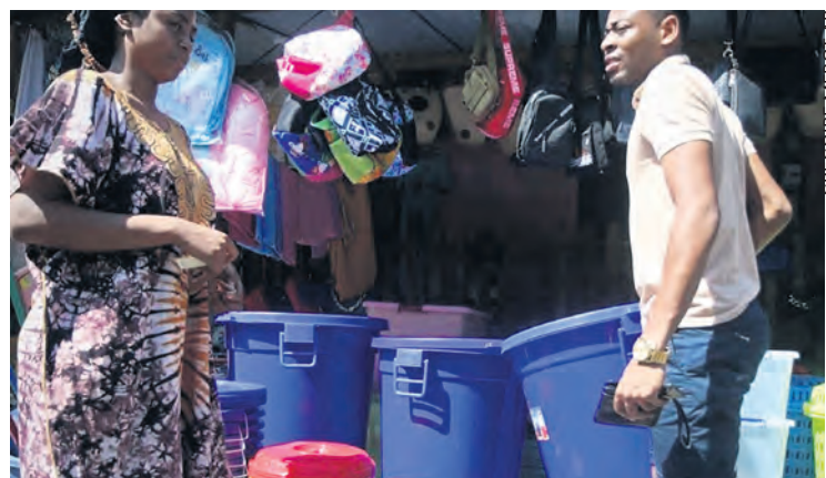
Vente de conteneurs d'eau le long de la route, dans le sud de Mayotte.