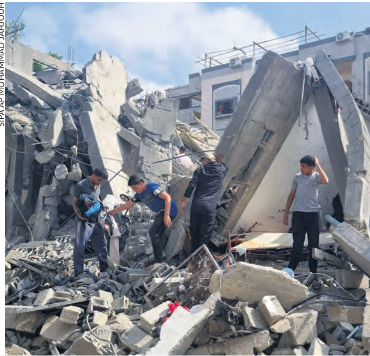
À Rafah, le 29 avril.

Sous l'égide des États-Unis et de certains de leurs relais au Moyen-Orient, des négociations en vue d'un cessez-le-feu de 40 jours viennent de franchir une première étape au Caire. Au même moment, bien loin de marquer une pause, l'offensive du gouvernement israélien à Gaza et la répression en Cisjordanie se renforcent.