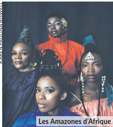
Les Amazones d'Afrique