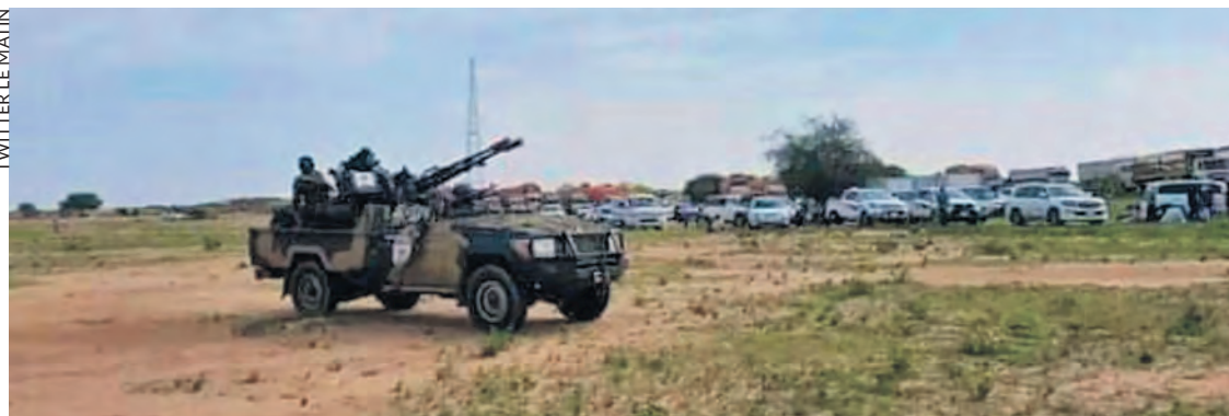
TWITTER LE MATIN