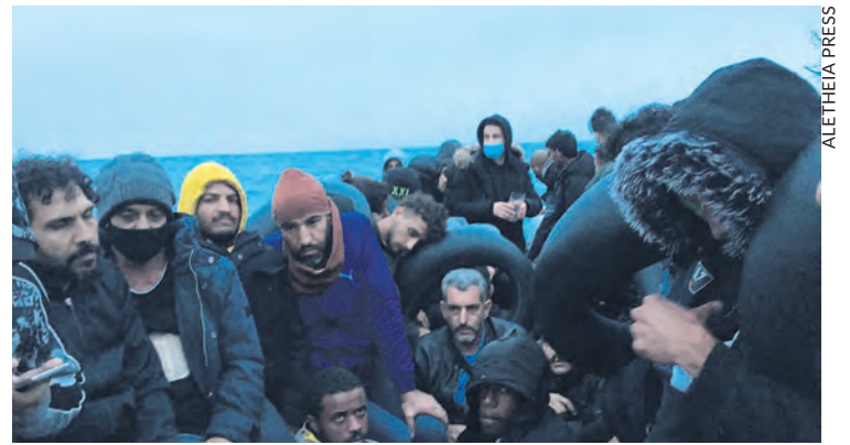
Lors d'une traversée précédente.

La même Défenseure des droits a rendu public le 25 avril un rapport qui dénonce le traitement des migrants, cette fois à la frontière franco-italienne. Alors que selon la circulaire Schengen, cette frontière devrait être ouverte, le gouvernement français y a rétabli des contrôles depuis 2015. Les droits des migrants ne sont pas respectés, notamment pour les demandeurs d'asile, qui sont refoulés sans avoir eu