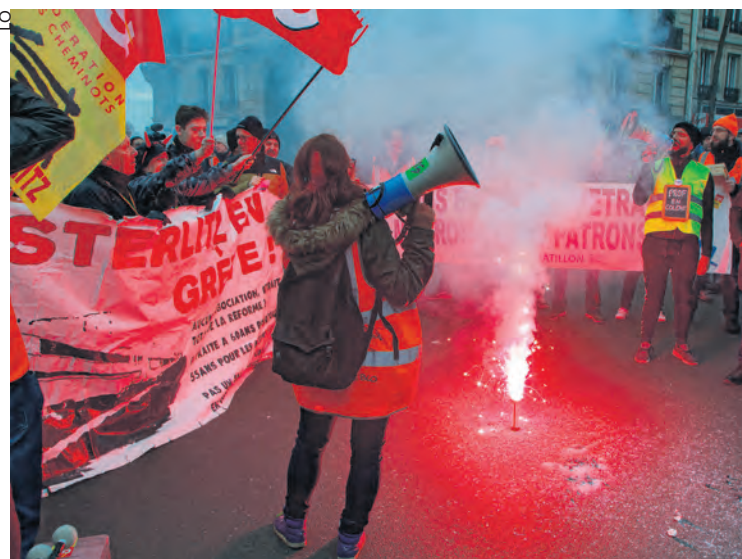
Cheminots contre la réforme des retraites, en décembre 2019.