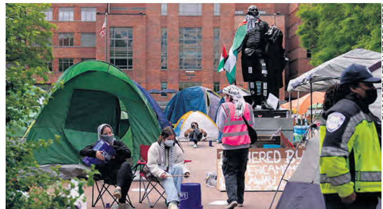
Devant l'université George-Washington, le 26 avril.