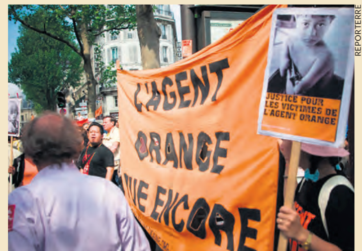
Précédente manifestation en soutien à Tran Tô Nga.