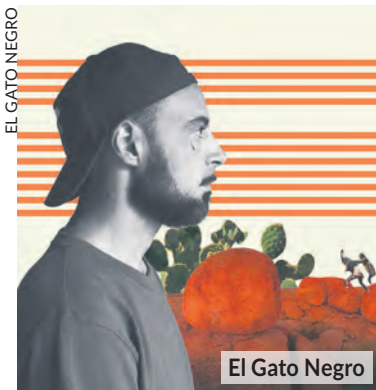
El Gato Negro