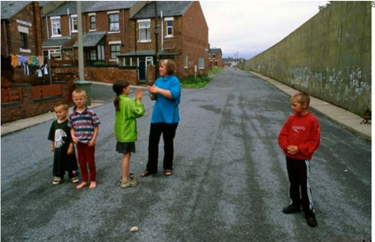
En Grande-Bretagne, 14 millions de personnes vivent sous le seuil de pauvreté, notamment dans les déserts industriels, comme ce village minier au Nord-Est de l'Angleterre.

Les débats politiques qui vont se dérouler au moment des élections européennes s'orientent vers l'opposition de deux camps, l'un pour pousser l'Union européenne plus loin, l'autre contre. Ce sera une discussion aussi biaisée que celle qui, en opposant la gauche à la droite, a tenu lieu ici en France d'expression de la démocratie. Les deux camps politiques qui se feront face se soucient aussi peu de l'Europe que de leurs peuples.