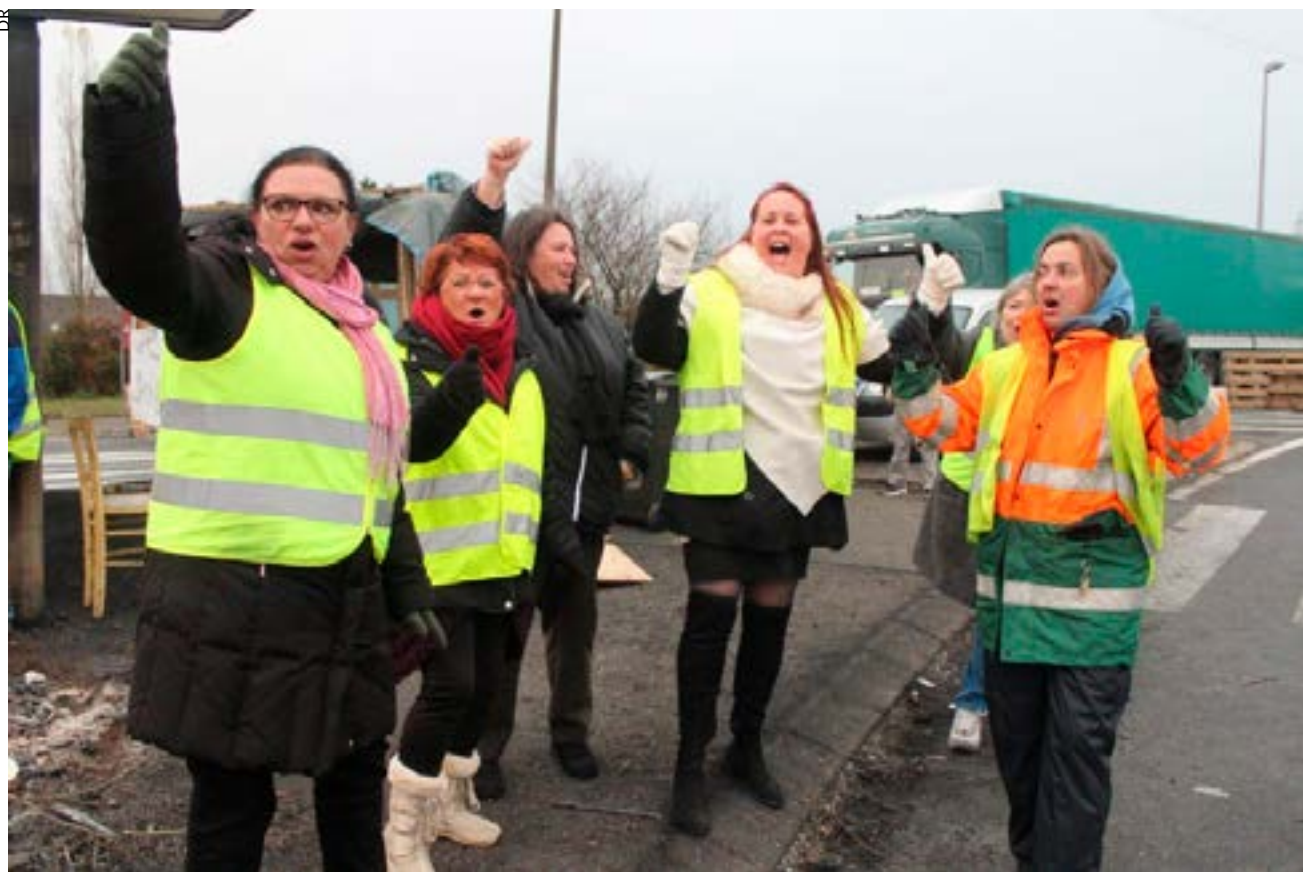
Un rond-point à Saint-Étienne-du-Rouvray, près de Rouen, fin novembre 2018.

Et les gilets jaunes ont compris une chose, que les dirigeants syndicaux ont voulu faire oublier, c'est que l'essentiel est dans le rapport de force. Tout cela illustre ce que nous répétons souvent : les travailleurs ont des ressources extraordinaires, quand ils se mettent en branle, ils apprennent vite. Si le mouvement ouvrier organisé pouvait s'inspirer de tout cela, ce serait déjà bien !