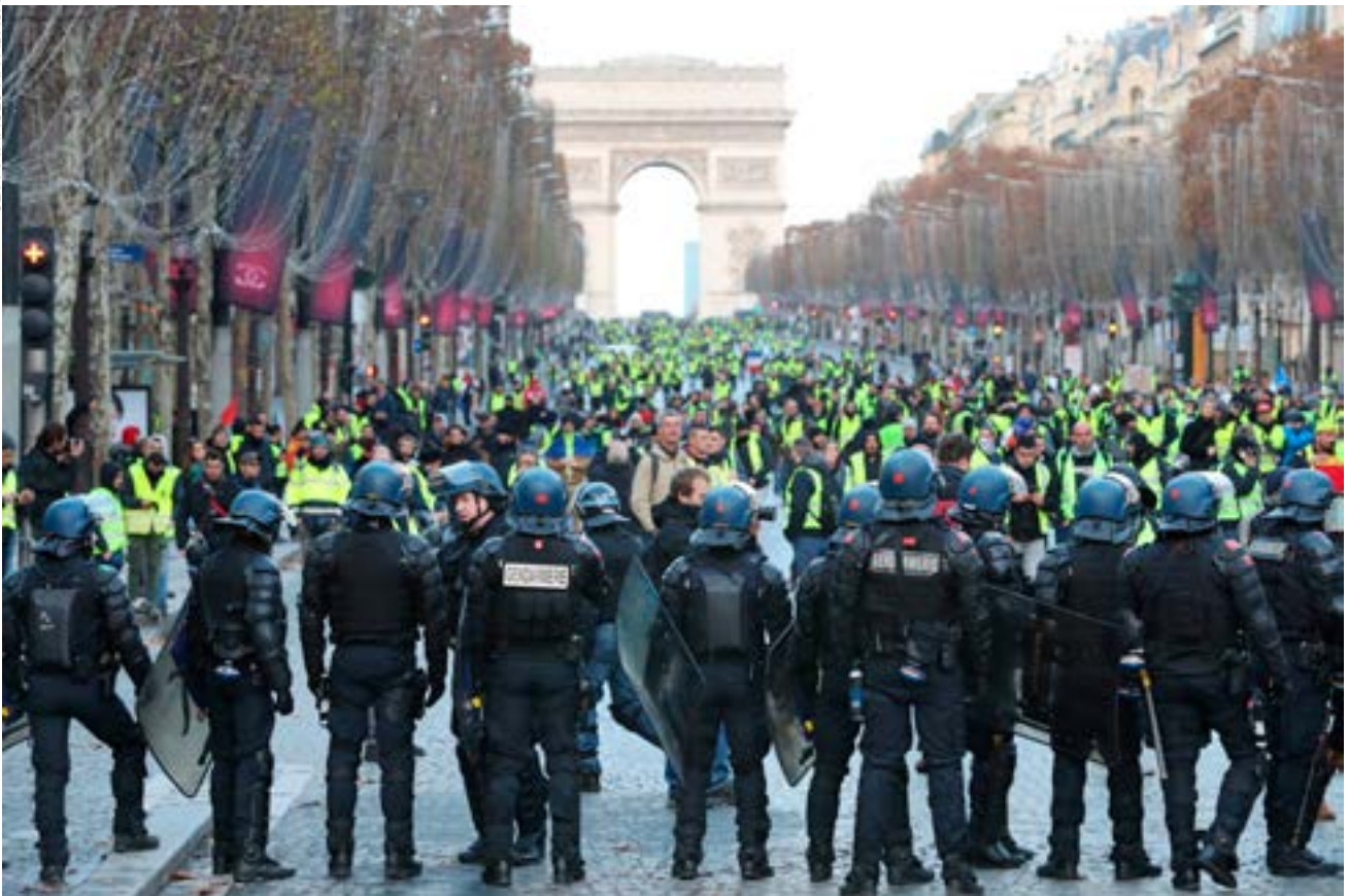
Manifestation sur les Champs-Élysées, samedi 8 décembre 2018.