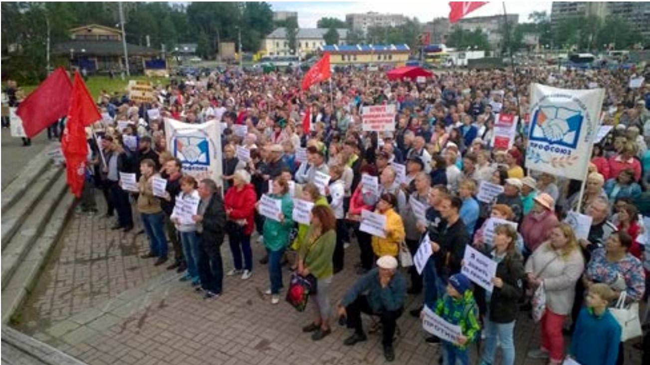
Manifestation de salariés des hôpitaux et de l'enseignement à Tcherépovets, ville industrielle du Nord-Ouest de la Russie. Sur des pancartes : « Je veux vivre au moins jusqu'à ma retraite ! »

moins de la grandeur retrouvée du pays, dans le but d'enchaîner la population au char de la bureaucratie russe et de lui faire oublier son sort, en tout cas l'envie d'en changer.