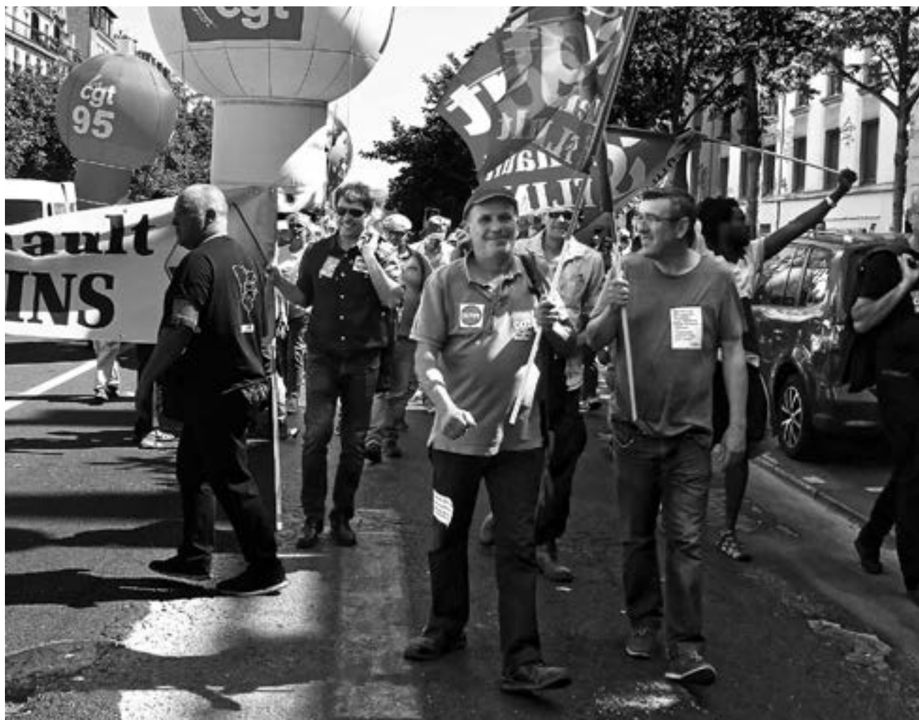
Lors d'une manifestation interprofessionnelle, le 28 juin 2018, à Paris.

Alors, camarades, bon courage pour l'activité! Ayons de la détermination et de l'enthousiasme dans ce que nous faisons et, surtout, pour ce que nous devons faire!