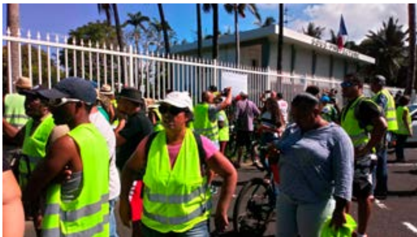
Gilets jaunes devant la sous-préfecture de Saint-Benoît lors de la rencontre avec la ministre de l'Outre-mer, Annick Girardin, le 29 novembre 2018.

Sa composition est sans doute semblable à celle de la métropole : un mélange assez populaire de gens aux fins de mois difficiles et d'une petite bour-