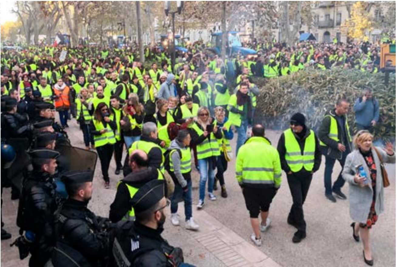
Manifestation à Nîmes, samedi 8 décembre 2018.