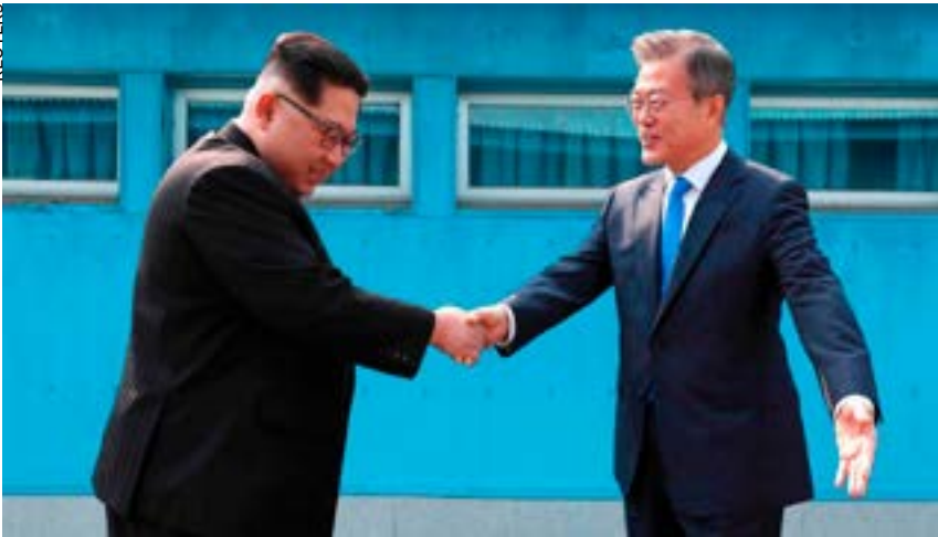
Le dirigeant nord-coréen Kim Jong-un et le président sud-coréen Moon Jae-in ont échangé une poignée de main, vendredi 27 avril 2018, sur la ligne de démarcation militaire qui divise la péninsule.

sances impérialistes moins que quiconque), c'est la capacité qu'a cet État d'un pays encore largement sous-développé à résister à l'impérialisme qui fait son péché originel aux yeux de ce dernier.