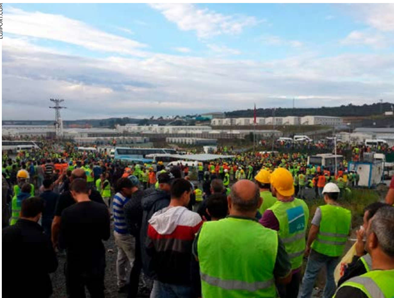
Meeting sur le chantier du nouvel aéroport d'Istanbul en septembre 2018.

sivement le pays car ils n'ont plus confiance et ils espèrent de meilleurs profits ailleurs. La Turquie s'est fortement endettée auprès des banques occidentales, mais cela a servi en grande partie à des dépenses de prestige pour Erdogan, plus que pour développer l'industrie ou l'agriculture.