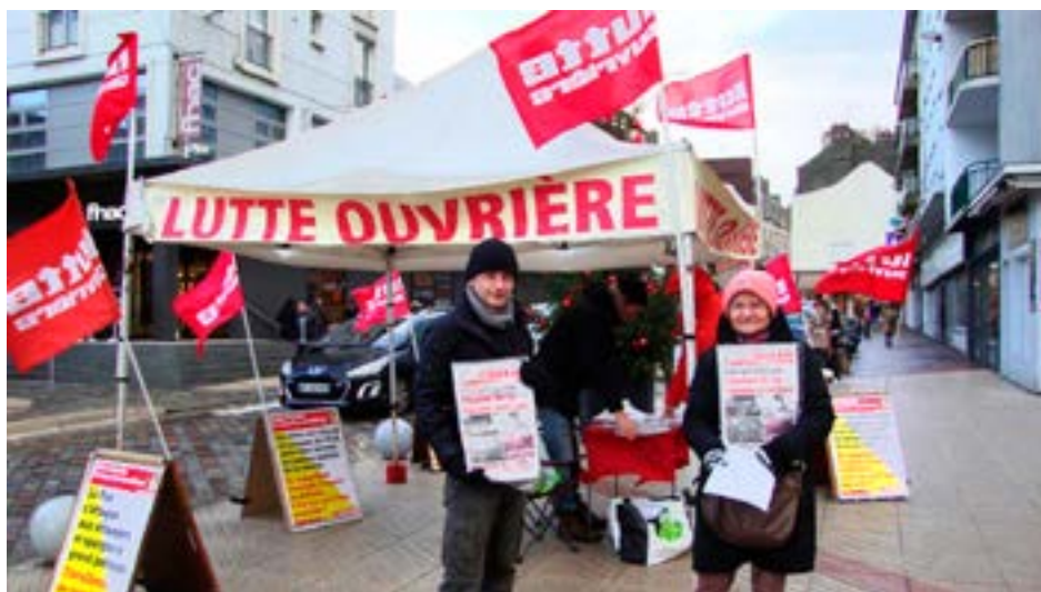
Stand dans les rues de Boulogne-sur-mer.

Nous devons agir là où nous sommes et faire ce que nous devons faire, en premier lieu préserver et transmettre les idées de la lutte de classe, la perspective de l'émancipation sociale, les faire vivre et les développer dans la classe qui pourra les transformer en force sociale capable d'«ébranler le monde» (et peut-être, cette fois, définitivement). Et si le marxisme nous a appris quelque chose, c'est que tant que dure la société de classe, avec ses contradictions, elle fera surgir les forces et les hommes qui la détruiront. À moins de sombrer dans la barbarie. Même si la société commence déjà à s'y enfoncer, nous n'arrêterons pas le combat.