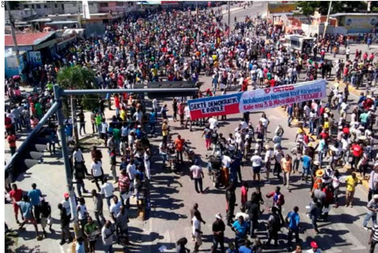
Manifestation contre le scandale PetroCaribe, à Port-au-Prince, le 26 juin 2018.

de transport public qui avaient tenté de briser la grève ont été abattus par balles, probablement par les bras armés de l'opposition. Selon nos camarades et nos contacts sur la zone industrielle, plus d'une douzaine d'ouvriers ont été aussi assassinés en se rendant à pied au travail tôt le matin. Des centaines d'autres ont été malmenés par les partisans de l'opposition. La terreur était telle que la grève s'est étendue au troisième jour sans appel officiel. Le pouvoir et l'opposition utilisent donc la même méthode pour satisfaire leurs ambitions politiques: la terreur contre la population dont ils prétendent être les défenseurs.