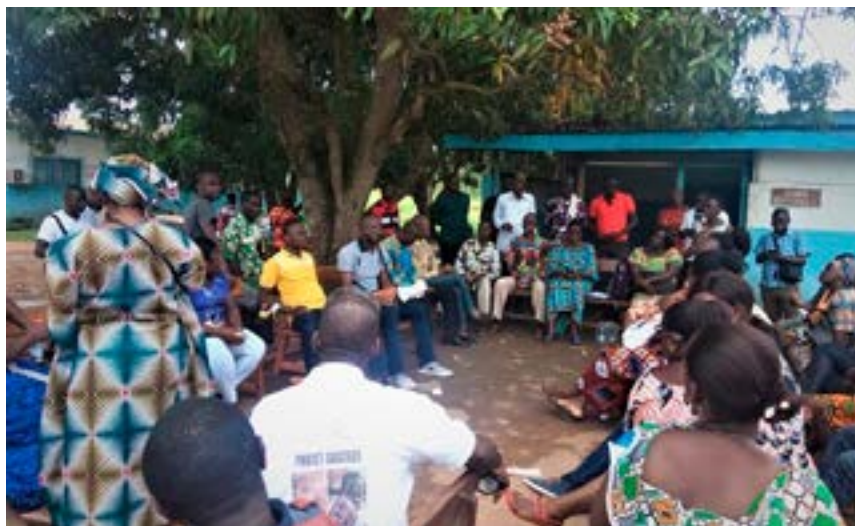
Côte d'Ivoire : piquet de grève des agents de la santé au CHR de San Pedro, le 7 novembre 2018.

Sur le plan social, nous avons assisté à deux grèves qui sortent de l'ordinaire dans la fonction