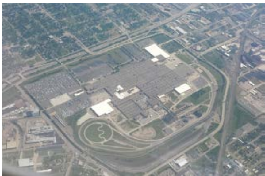
Au début des années 1980, des quartiers de Detroit et de Hamtramck ont été détruits pour construire l'usine. Aujourd'hui, GM est en train de fermer ce site, laissant une friche industrielle au milieu de la ville.

Et, comme pour souligner ce fait, dans la foulée des élections General Motors a annoncé qu'il arrêterait la production de cinq usines aux États-Unis et au Canada, supprimant 14 700 emplois, ainsi que la fermeture de deux autres usines dans d'autres pays. C'est un avertissement aux travailleurs de l'automobile, dont le contrat doit être renégocié cette année avec le syndicat, sur les sacrifices supplémentaires qui leur seront demandés. Au-delà, c'est l'affirmation que GM est prêt à démanteler son appareil de production pour satisfaire les