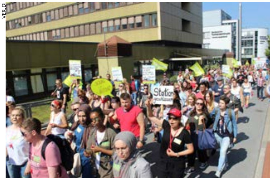
Manifestation de grévistes sur le site du CHU de Essen, le 27 juin 2018.

manifestations musclées et des chasses aux immigrés, ont brutalement mis en lumière cette détérioration.