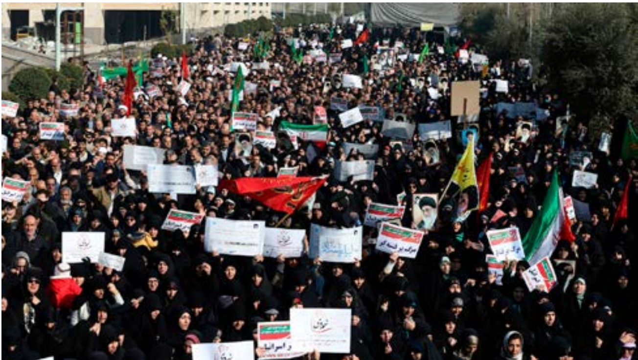
Des manifestants crient des slogans contre l'effondrement économique, le 30 décembre 2017 à Téhéran.