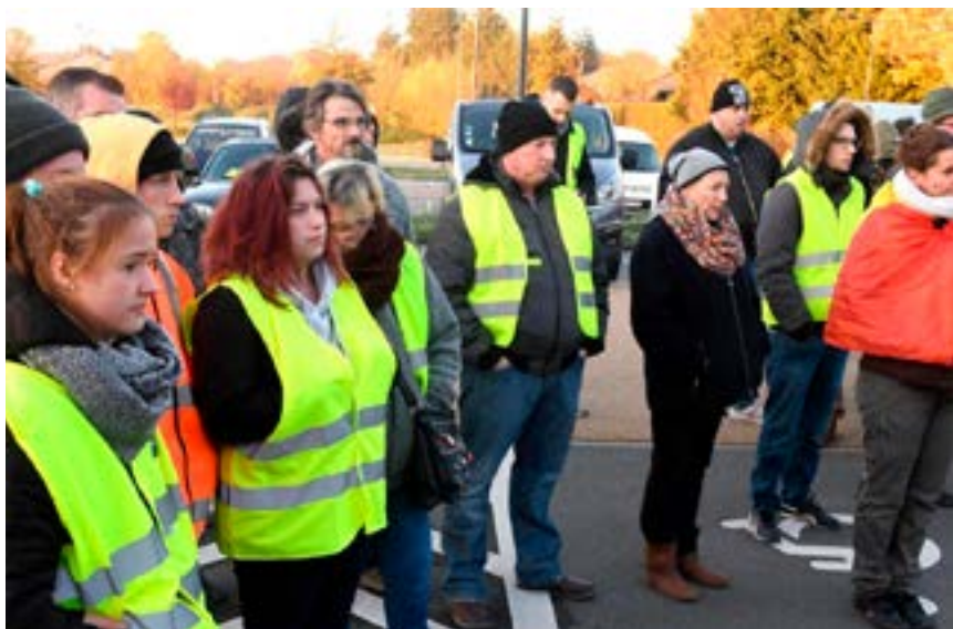
Belgique : gilets jaunes à Tournai, le 17 novembre 2018.

Le mouvement des gilets jaunes a été contagieux, surtout en Wallonie, où aucune barrière de langue n'empêche la contagion. Cependant il y a moins de monde mobilisé qu'en France. Bien que très minoritaire et limité dans ses revendications, ce mouvement a changé un peu le climat. Le fait d'oser hurler sa rage, ça fait la différence par rapport à se taire. Ce mouvement intervient entre deux élections. Il y aura les élections législatives en mai 2019. Et nous sortons des élections communales en octobre dernier.