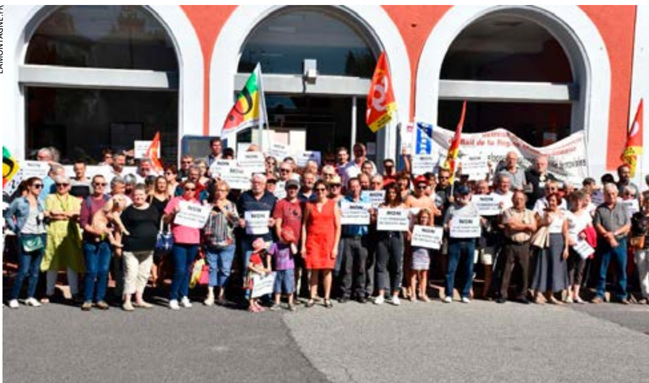
« Non à la fermeture du guichet SNCF ». Devant la gare de Commentry (Allier) le 8 septembre 2018.

faire appel en cas de besoin. Nous l'avons vu récemment sur les Champs-Élysées, comme au moment de la bagarre des travailleurs de Goodyear, etc. Mais l'État ne les sort pas si souvent que cela car l'efficacité des forces de répression est limitée, et leur utilisation peut avoir l'effet exactement contraire à ce que les gouvernants en escomptent. Ce qui se passe en ce moment en Haïti l'illustre.