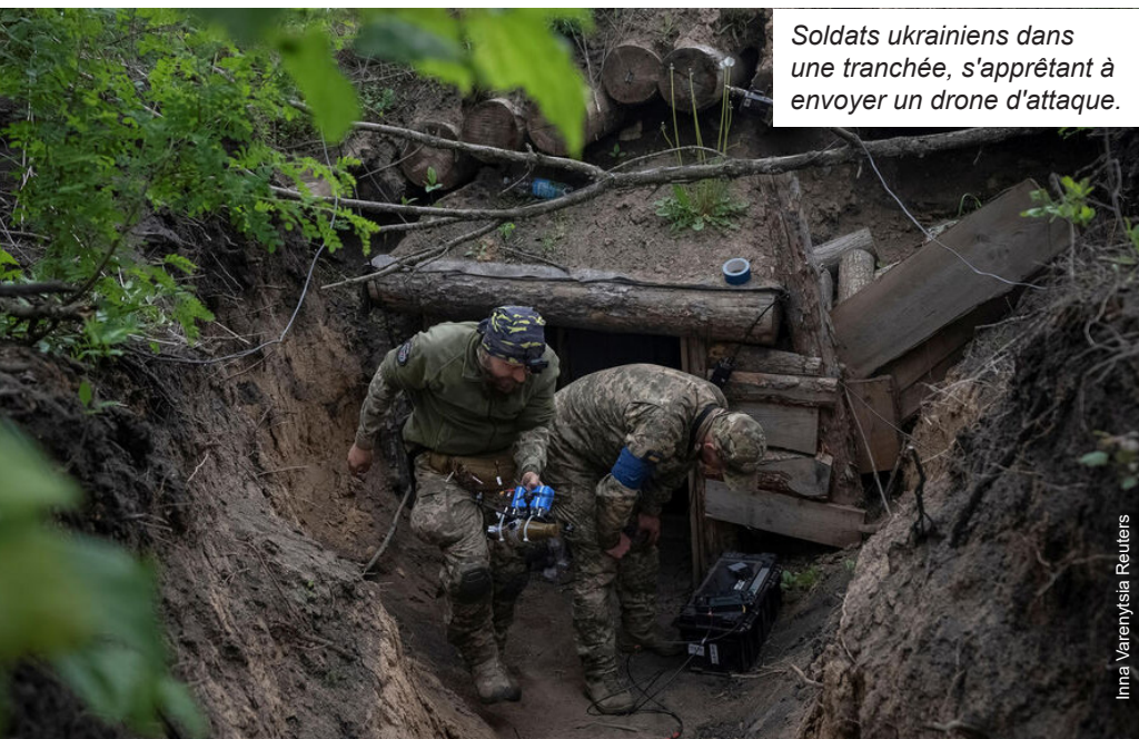
Soldats ukrainiens dans une tranchée, s'appêtant à envoyer un drone d'attaque.

Ce sont des guerres pour contrôler le pétrole, les terres rares, les matières premières ou des voies stratégiques comme le canal de Suez ou le détroit d'Ormuz. Car, derrière les belligérants directement impliqués, les puissances impérialistes sont toujours à la manœuvre.