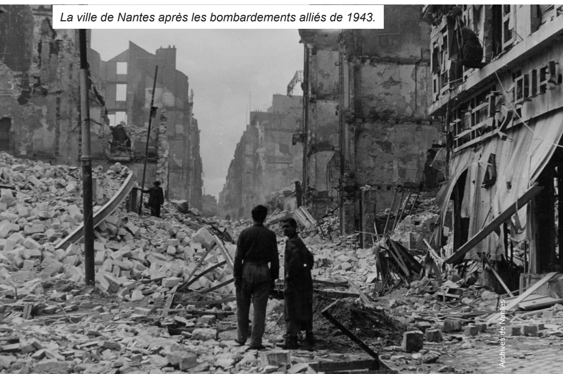
La ville de Nantes après les bombardements alliés de 1943.

La guerre économique à laquelle se livrent les grands groupes de toute la planète n'est pas la nôtre. Refusons d'en être la chair à profits !