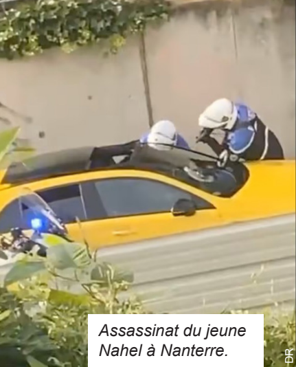
Assassinat du jeune Nahel à Nanterre.