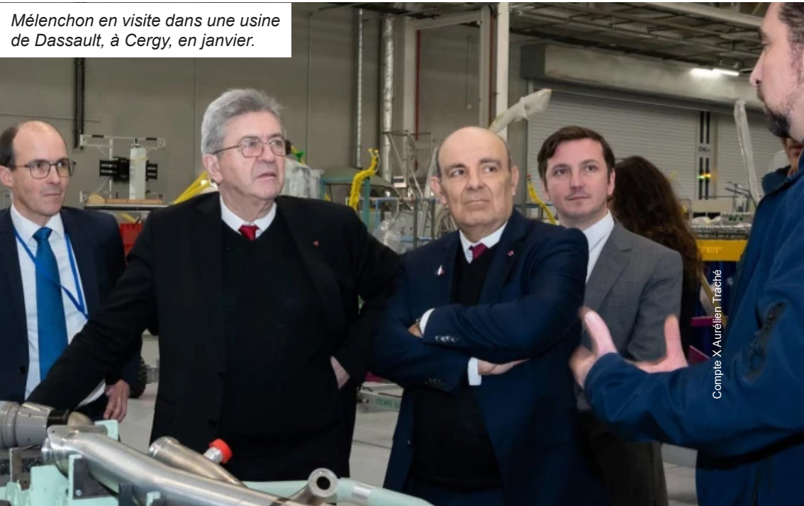
Mélenchon en visite dans une usine de Dassault, à Cergy, en janvier.

Chacun des candidats qui se bousculent pour prendre la suite de Macron à l'Élysée mènera, au pouvoir, la politique exigée par les grands patrons. Car tous respectent leur propriété privée, c'est-à-dire