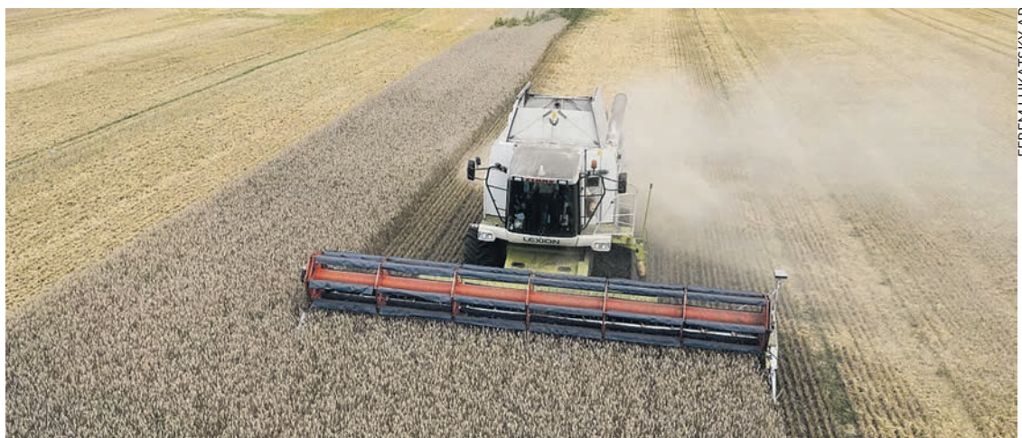
Les terres à blé convoitées d'Ukraine.