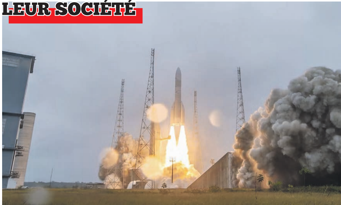
ESA, CNES, ARIANESPACE