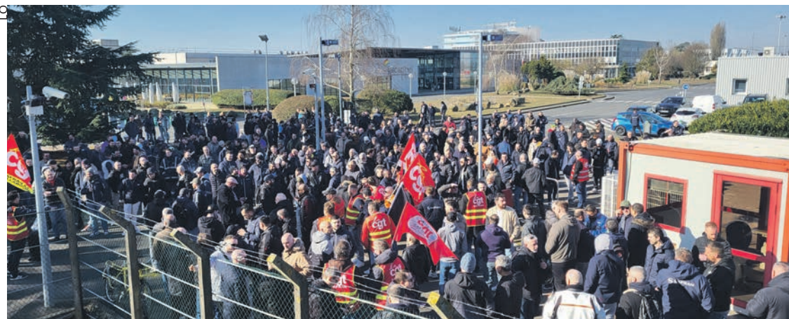
À l'usine de Villaroche.

ateliers. Des débrayages et des rassemblements quotidiens ont été décidés. Des actions similaires sont également prévues sur d'autres sites. À l'usine de Commercy, dans la Meuse, qui emploie autour de 200 personnes à la fabrication d'aubes de moteurs, la grève est totale depuis le 5 mars, avec piquet de grève à l'entrée du site.