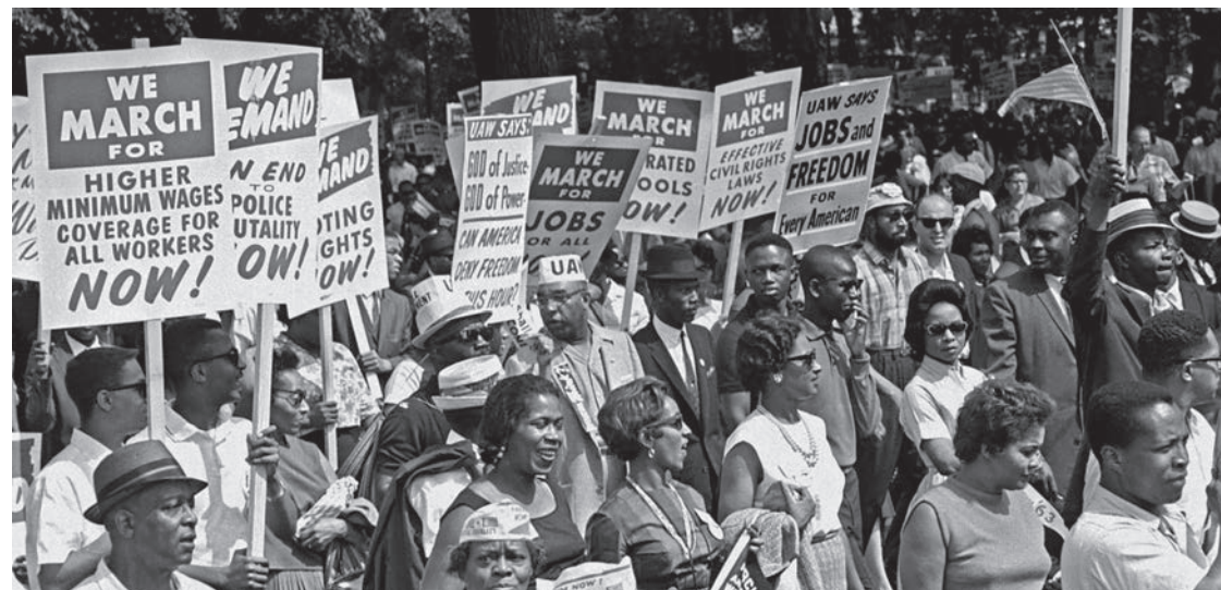
Une manifestation pour les droits des travailleurs noirs dans les années 1960.