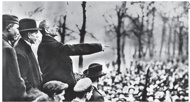
Karl Liebknecht, «l'ennemi est dans notre pays». Berlin en 1918.

Quand tous ceux-là parlent de la « sécurité européenne », c'est pour demander aux travailleurs de faire confiance à leur État national pour les protéger. Mais qui peut croire que Macron et l'État français,