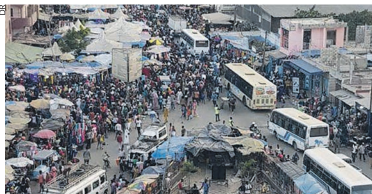
Marchands de rue à Keur Massar.