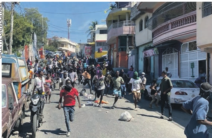
Port-au-Prince le 20 février lors de la manifestation des habitants de Solino.

Cet article est tiré du journal La Voix des travailleurs , édité par nos camarades de l'OTR (Organisation des travailleurs révolutionnaires) - UCI-Haïti.