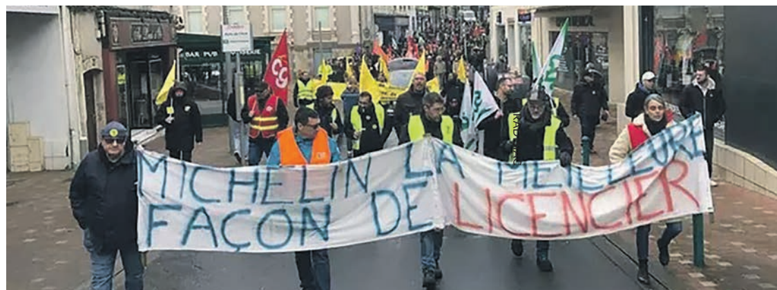
Manifestation des travailleurs de Michelin, le 22 janvier à Cholet.

le comité de lutte dans un tract, si les travailleurs sont « sonnés », ils ne sont « pas KO ». Ils savaient que le combat serait dur car Michelin a des raisons multiples de ne rien céder. Pour le patron, qui projette de nouvelles fermetures d'usines, il s'agit de décourager à l'avance ceux qui tenteraient de s'y