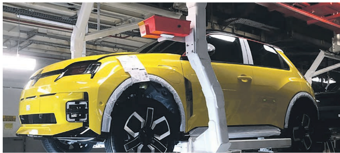
Nouvelle R5 à l'usine de Douai.

Séjourné a promis des subventions à la production de batteries, sous prétexte