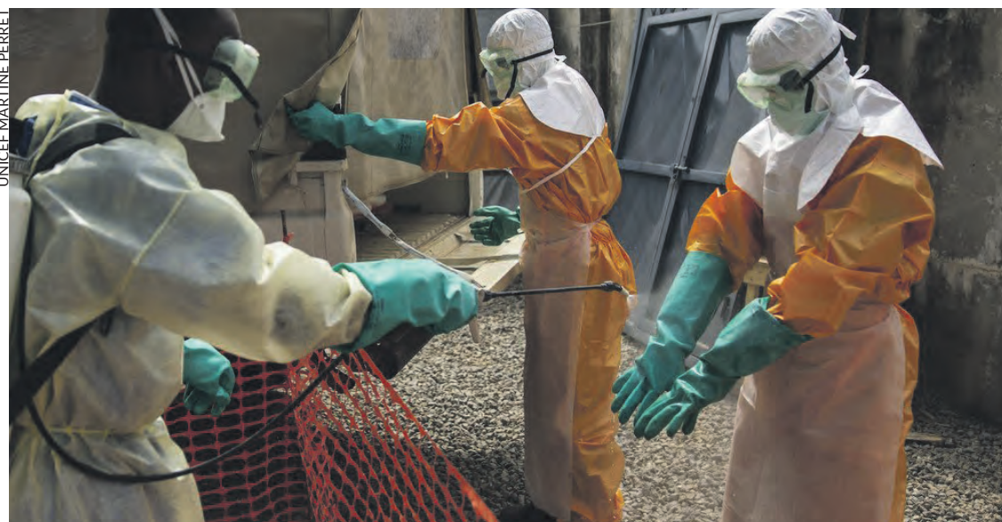
Rinçage des équipements de protection contre le virus Ebola lors d'une précédente épidémie.