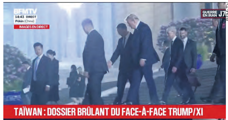
Trump et Xi Jinping.

Dans ces négociations, Xi Jinping a visiblement obtenu quelques déclarations américaines sur Taïwan. Au moment de repartir, Trump a affirmé qu'il s'oppose à ce que « quiconque aille vers l'indépendance », que les Américains « [ne parcourront pas] 15 300 kilomètres pour faire la guerre », que « les ventes d'armes [de Washington à Taïwan] sont toujours en suspens ». Depuis la fin des années 1970, le statu quo entre la Chine et les États-Unis veut que l'indépendance de fait de Taïwan n'est pas reconnue par les grandes puissances. En s'opposant à une indépendance officielle de Taïwan,