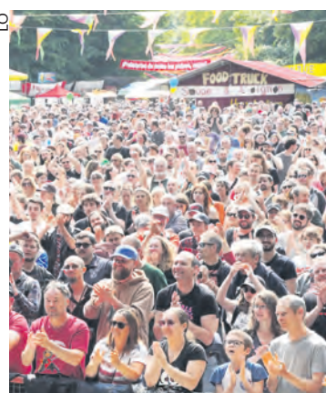
La fête de Lutte ouvrière à Presles 7 à 10