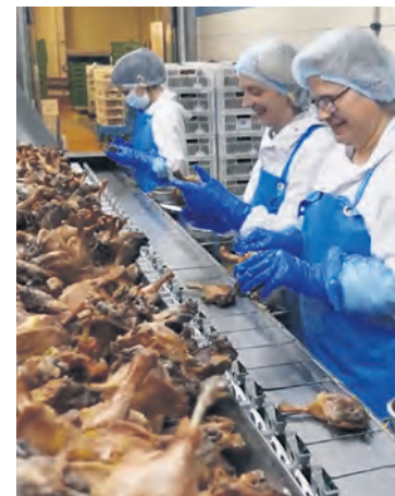
L'atelier de confit de canard Euralis.

La présence d'une vingtaine de véhicules de secours sur le parking de UP2 montrait que le risque était élevé. La direction – et la presse locale à ses