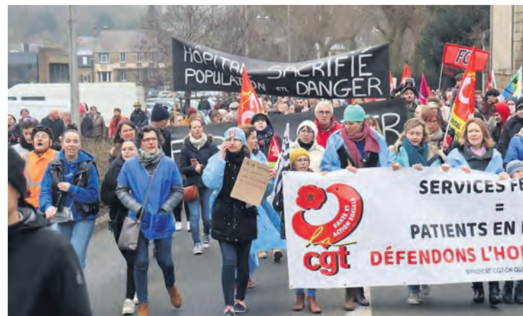
Manifestation en février 2025 contre la fermeture de services à Guingamp dans les Côtes-d'Armor.

En fait, la question essentielle reste les capacités d'accueil hospitalières. L'absence de vaccin n'empêche en effet pas les soins. Il existe des systèmes d'oxygénation extracorporelle capables d'augmenter les chances de survie des patients graves. Mais encore faut-il en avoir en nombre