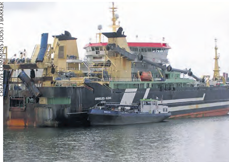
Alienes Ilena, le plus grand chalutier du monde.