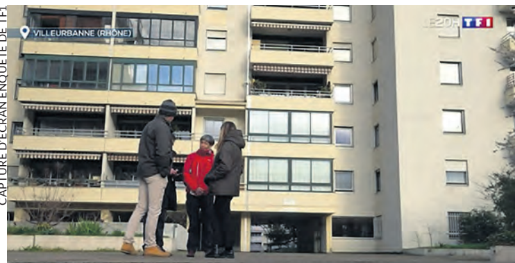
Dans le quartier du Tonkin à Villeurbanne, des habitants s'organisent pour effectuer des rondes et dissuader les dealers.

Trois événements tragiques ont récemment rappelé combien le trafic de drogue et les conséquences de la guerre des gangs pèsent sur la vie quotidienne dans bien des quartiers populaires.