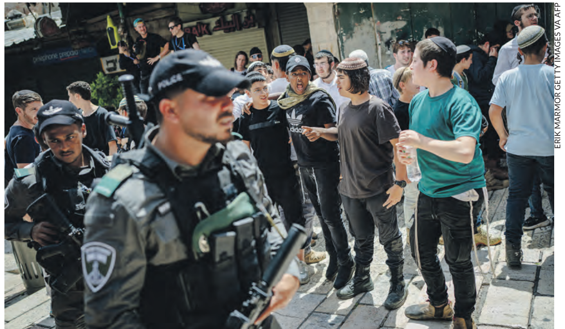
Policiers israéliens et jeunes colons d'extrême droite à Jérusalem, le 14 mai.

Cet activisme d'extrême droite finit par alarmer une partie des Israéliens, y compris parmi des responsables, en fonction ou à la retraite, de l'appareil militaire et sécuritaire du pays. Fin mars, l'association