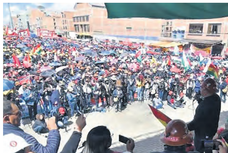
Rassemblement à l'appel de la COB, le 1 er mai à La Paz.