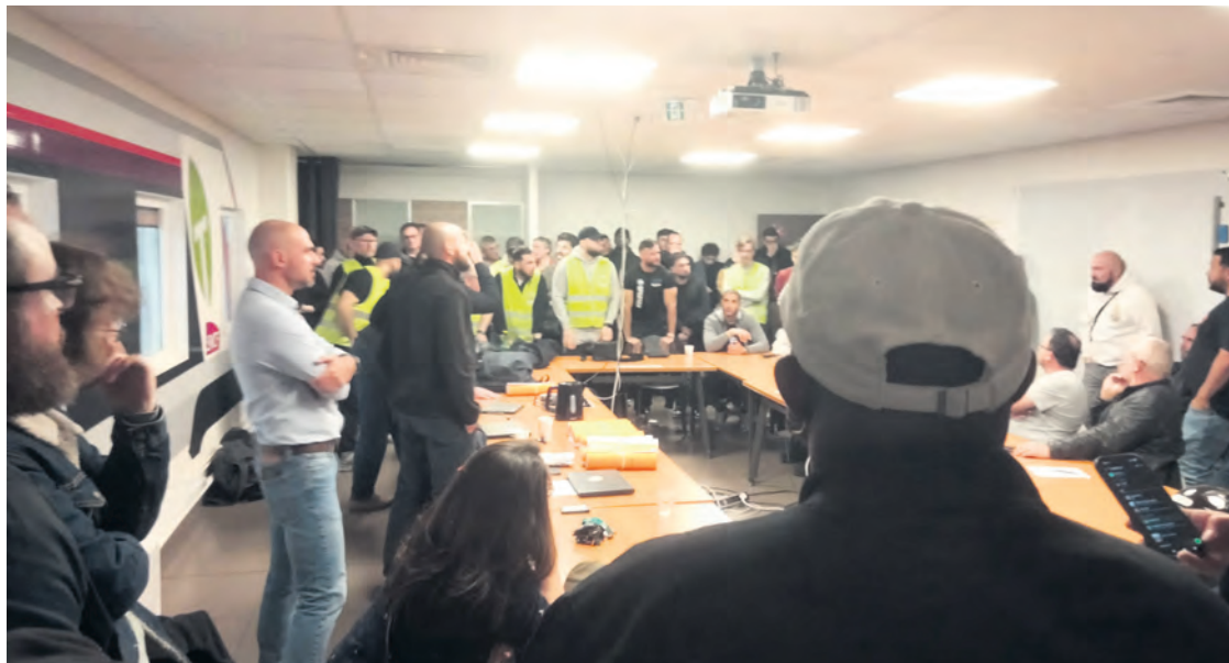
Assemblée des grévistes à Saint-Lazare, le 12 mai.

Les conducteurs du secteur n'ont pas laissé ces annonces sans réponse. Après une interpellation de la direction par une vingtaine de conducteurs, une journée de grève a été préparée par des