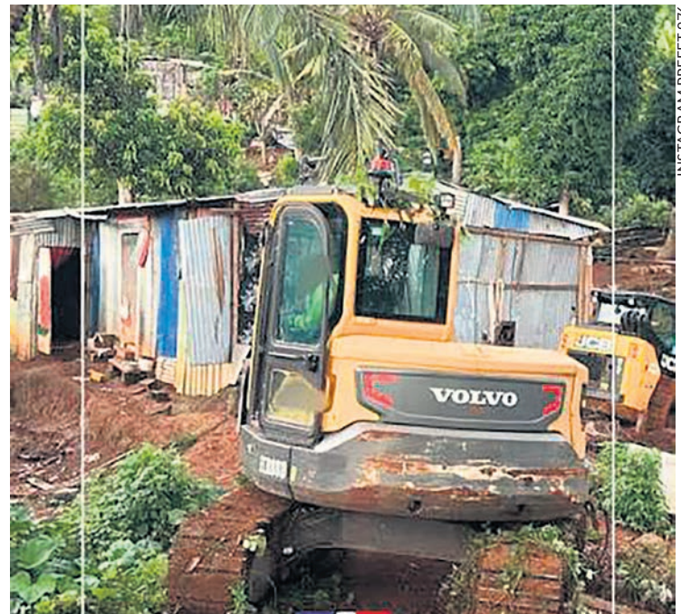
INSTAGRAM PREFET 976

La répression s'abat aussi sur les demandeurs d'asile, dont beaucoup arrivent de la République démocratique