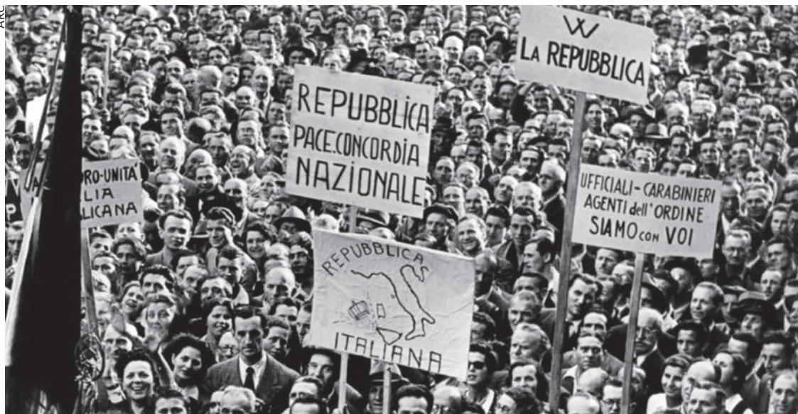
Manifestation après le référendum du 2 juin 1946.