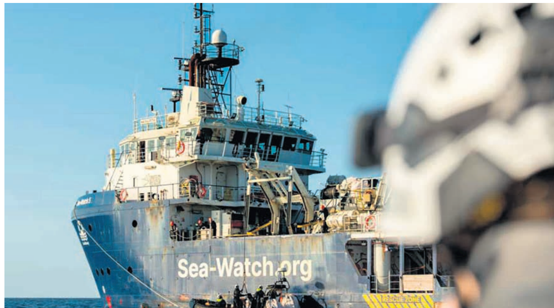
Le navire Sea-Watch 5 attaqué par les garde-côtes libyens.

Et pour cause, tous les secouristes connaissent le sort des migrants en Libye : ils sont au mieux emprisonnés ou, pire, réduits en esclavage. L'Union européenne ferme les yeux sur ces pratiques. L'Italie en particulier a passé des accords avec le gouvernement libyen à qui elle a fourni le navire qui a attaqué le Sea-Watch . Mais si le gouvernement de Meloni a donc largement sa part de responsabilité dans ces actes de piraterie, l'Union européenne s'est