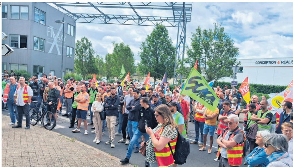
Le 10 juin devant la direction régionale atlantique.