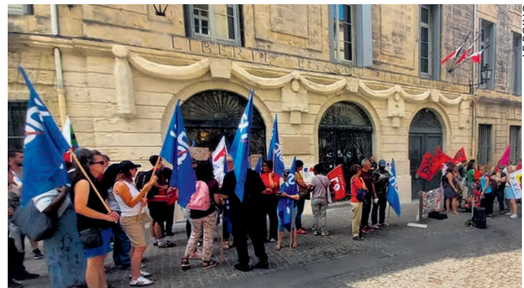
AESH devant le rectorat de Montpellier, le 9 juin.