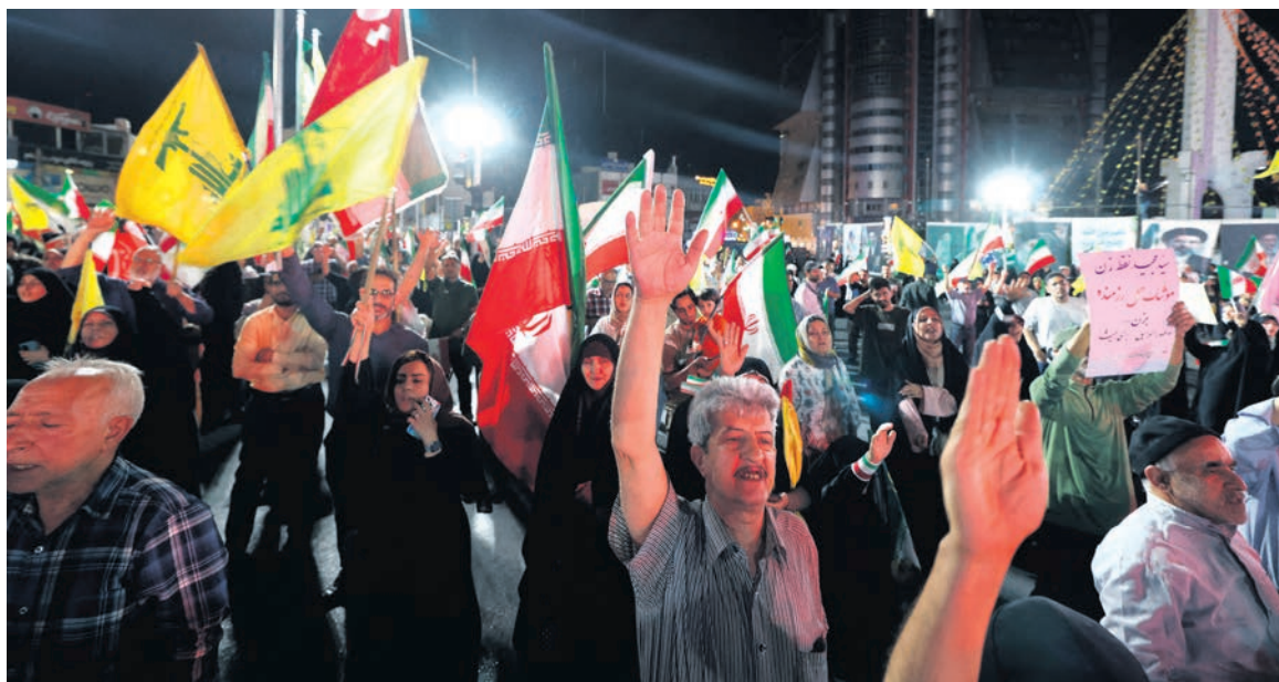
Téhéran, le 7 juin.

En même temps, la répression contre les opposants s'intensifie, marquée par des arrestations, des tortures, des exécutions par pendaison des manifestants arrêtés en janvier ou lors du mouvement Femmes, vie, liberté. Près de 700 condamnés ont été exécutés depuis le début de l'année.