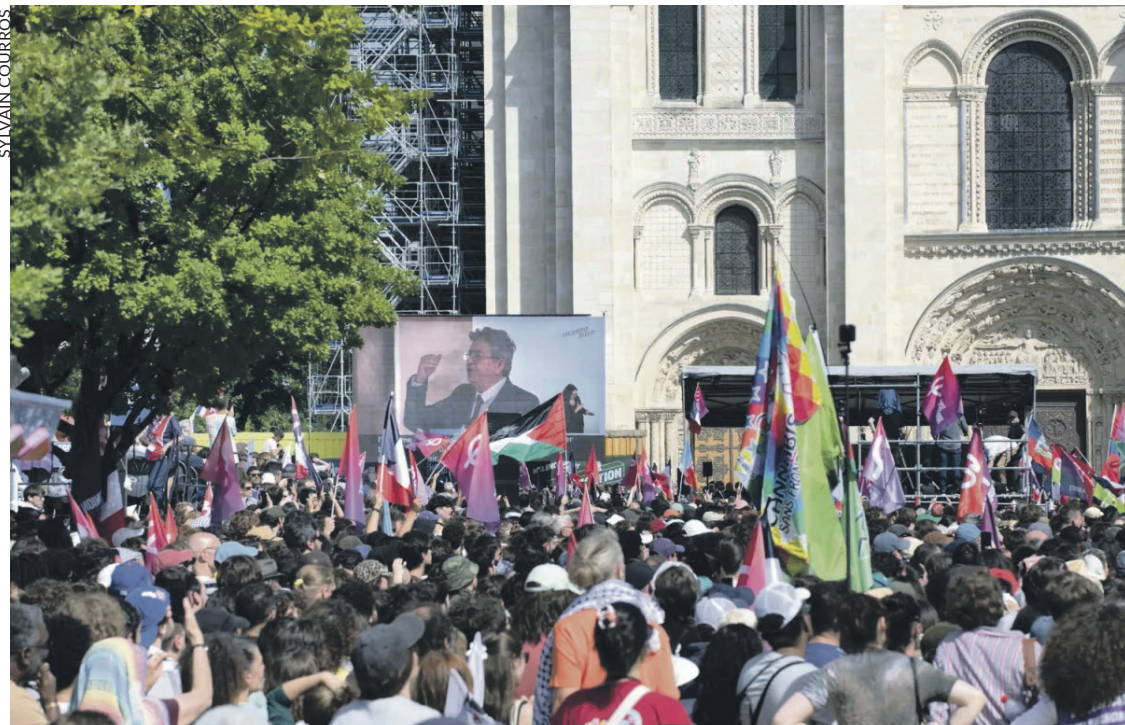
Le 7 juin à Saint-Denis.