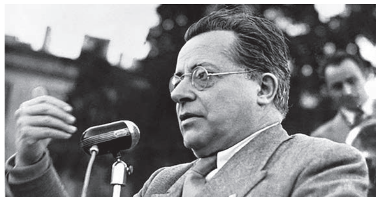
Togliatti en 1944.

De retour d'URSS en 1944, Togliatti, le dirigeant du PC italien, prononça un discours connu comme celui du « tournant de Salerne », du nom de la ville où il fut tenu. Devant des militants communistes médusés, il annonça que l'heure n'était pas, comme ils l'attendaient, à une révolution ouvrière, mais seulement à la libération du pays dans le cadre de la défaite allemande et