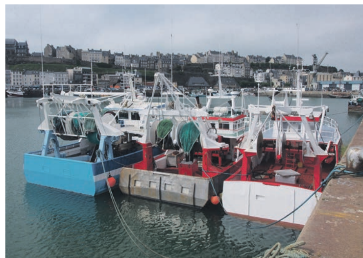
Chalutiers à Granville.