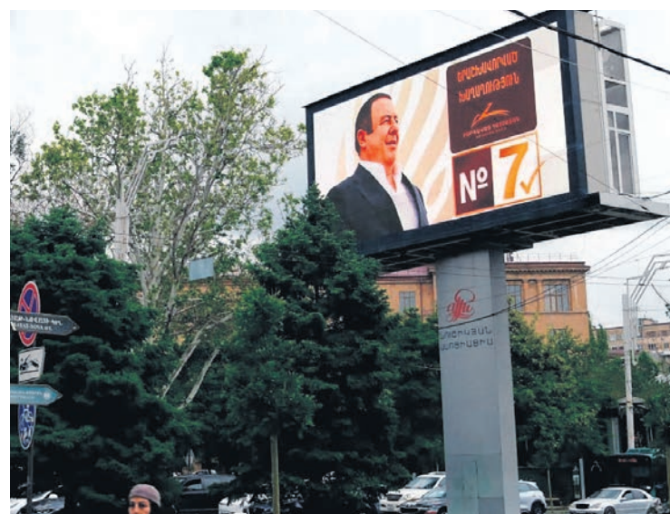
Publicité de campagne de Pachinian à Erevan.

Pachinian sait trop bien qu'il vaut mieux ne pas placer tous ses œufs dans le même panier : même tendues ces derniers temps, les relations avec Moscou restent essentielles à l'économie de l'Arménie, et dans une certaine mesure à ce qu'elle considère comme sa sécurité. Cela vaut aussi pour l'Iran, par