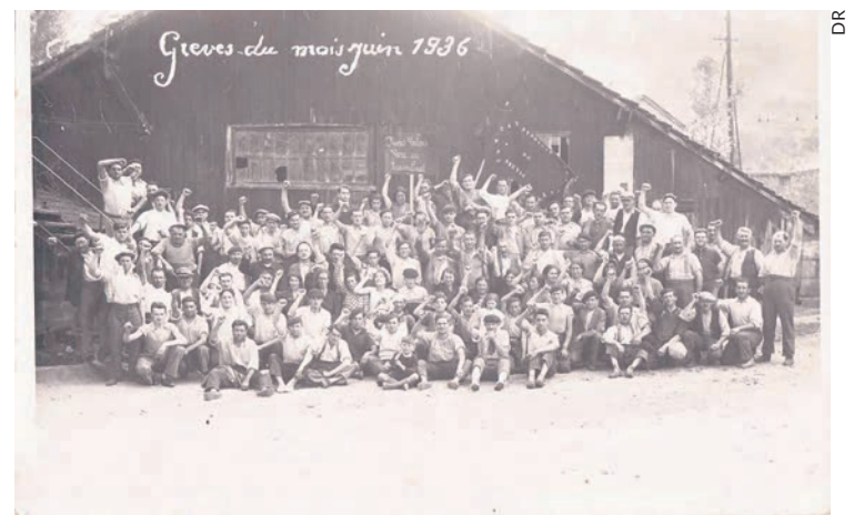
Bata en grève à Neuvic, en Dordogne.