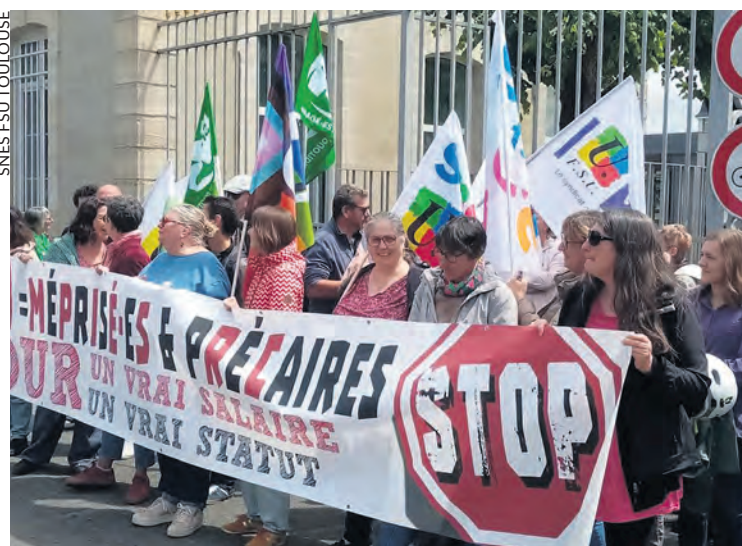
Manifestation contre la précarité dans la fonction publique à Toulouse.