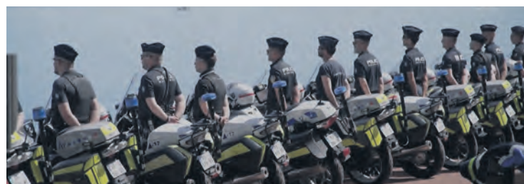
Le lac d'Évian-les-Bains sous haute surveillance lors du G7.

Le sommet du G7 a réuni du 15 au 17 juin les représentants de sept puissances impérialistes au bord du lac Léman.