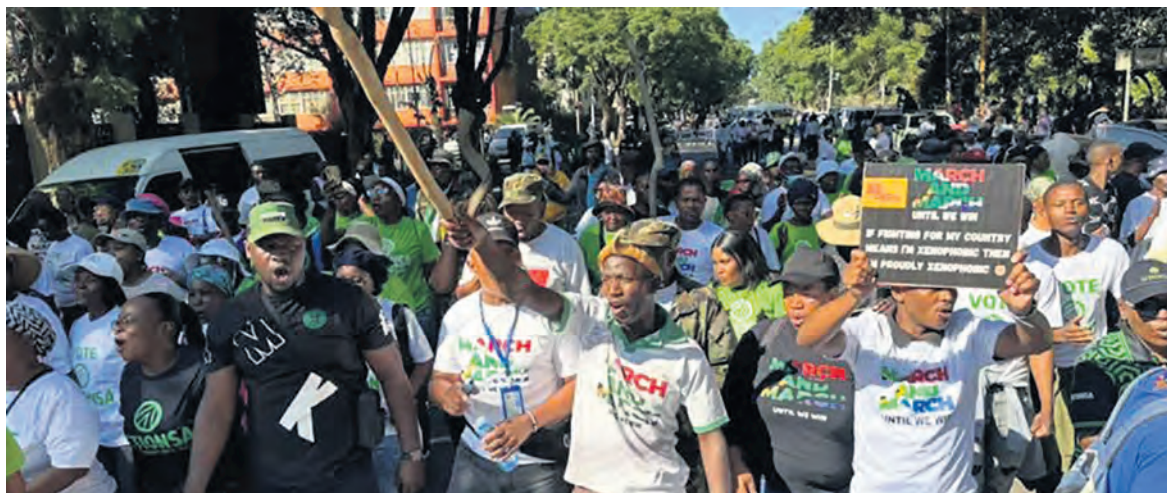
Manifestation contre l'immigration à Pretoria le 29 avril.

Les manifestations xénophobes ont ainsi pris de l'ampleur, laissant craindre qu'elles tournent à l'émeute antimigrants, comme celles qui ont déjà frappé le pays à plusieurs reprises depuis 2008. Pour finir, ces propagandistes ont décidé que les migrants devraient avoir