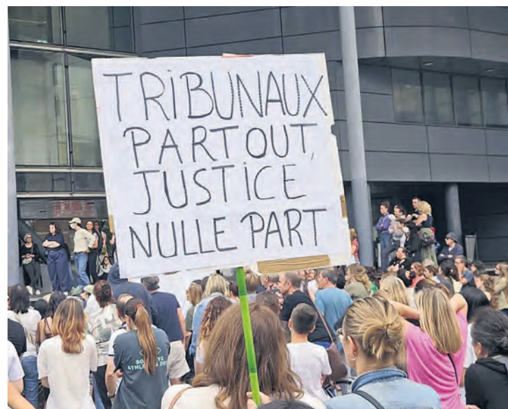
Rassemblement devant le Palais de justice de Grenoble.