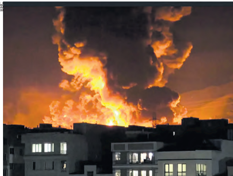
Bombardement israélien sur un dépôt de pétrole à Téhéran le 8 mars.

Trump a annoncé le 14 juin un accord entre les États-Unis et l'Iran incluant la réouverture imminente du détroit d'Ormuz. Un texte devait être signé le 19 juin à Genève, qui ne sera en fait qu'un accord provisoire qui ouvre de nouvelles tractations.