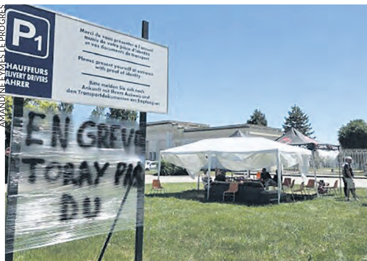
AMANDINE EYMES LE PROGRÈS