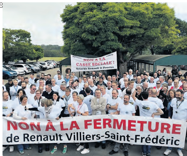
Rassemblement le 10 juin.

Mercredi 10 juin, la direction de Renault a organisé un comité social et économique (CSE) pour y présenter le projet « relocalisation des activités, moyens et équipes de Villiers-Saint-Frédéric », dans les Yvelines.