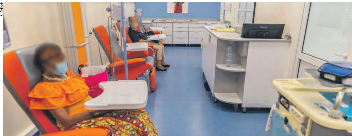
Une salle de chimiothérapie.