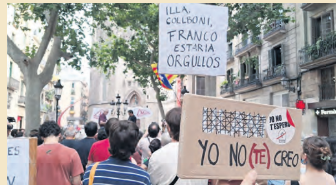
À Barcelone, contre la visite du pape. Dénonciation des responsables politiques (« Franco serait fier de vous ») et des mensonges de l'Église.