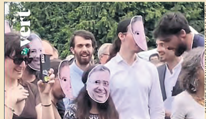
Manifestants déguisés en Patrick Pouyanné.

À l'École polytechnique, une trentaine d'élèves ont perturbé la cérémonie de remise des diplômes le 12 juin, affirmant leur rejet de ce que la société capitaliste fait de ses jeunes scientifiques les plus qualifiés.