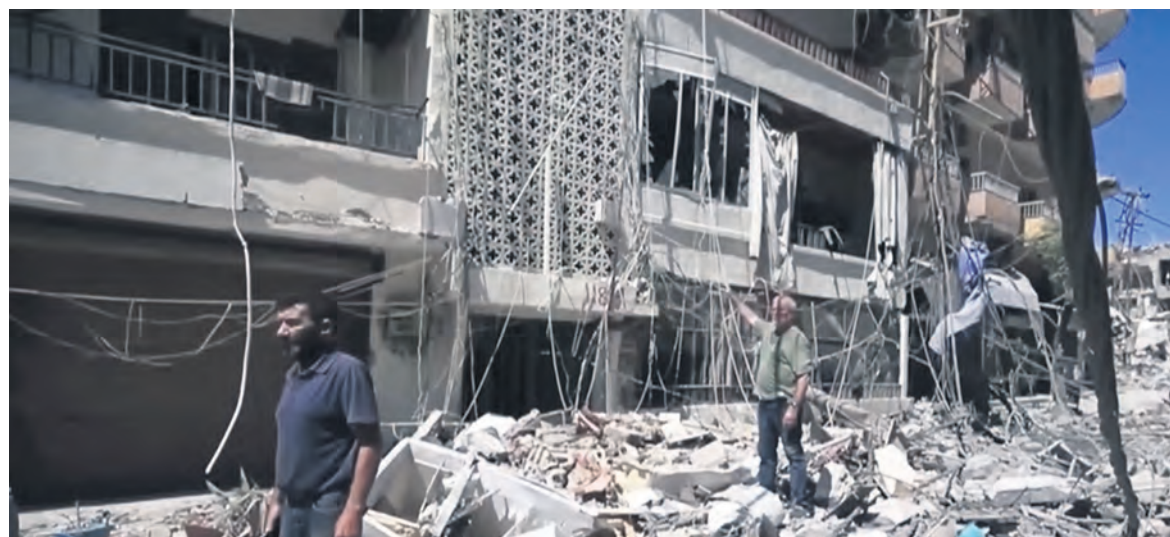
Après un bombardement israélien à Nabatiyé dans le Sud-Liban le 14 juin.

Alors que des élections législatives doivent avoir lieu au plus tard le 27 octobre, pour ne pas avoir l'air de « sacrifier la sécurité des Israéliens » aux calculs du locataire de la Maison Blanche, Netanyahu promet que l'armée israélienne restera au