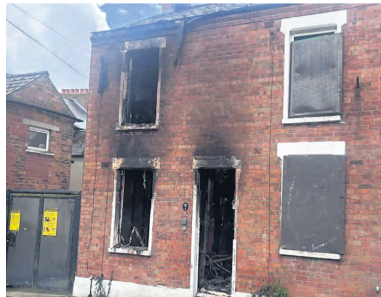
Une maison incendiée à Belfast.