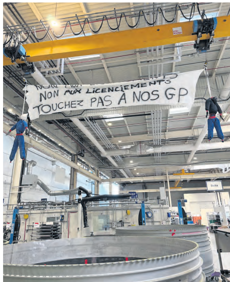
Lors d'un débrayage, en juin.