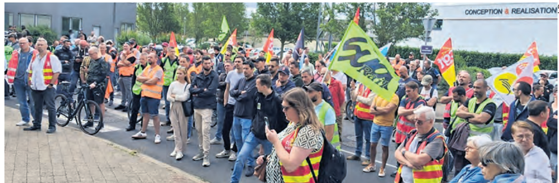
Rassemblement à Saint-Pierre des Corps le 10 juin.

Les suppressions de postes, le manque de moyens, le mépris de la direction et la multiplication des sanctions pour tenter de mettre au pas les cheminots ont aussi alimenté la colère. En gare des Aubrais, le 10 juin, la vente est donc restée fermée toute la journée et à l'accueil de la gare d'Orléans