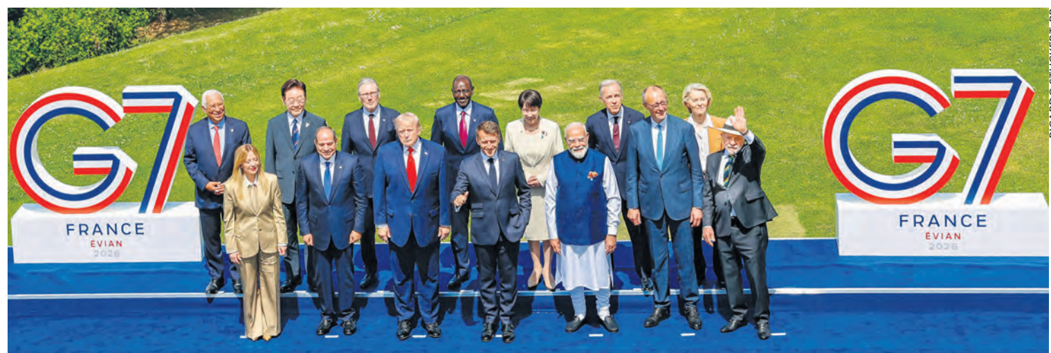
Photographie officielle du G7 à Évian le 16 juin 2026.