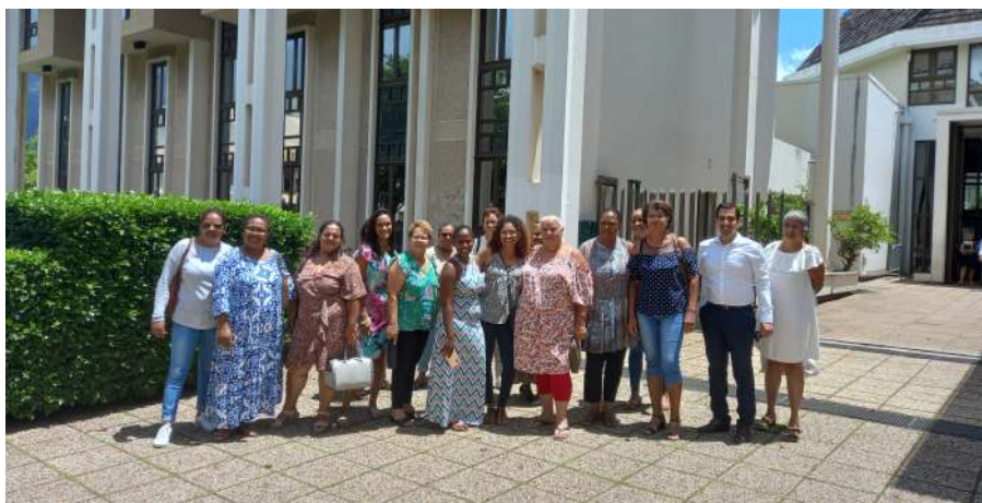
Une délégation de salariées de Korbey d'Or devant le tribunal de Commerce

Frédéric Maillot, député NUPES, s'est indigné dans un courrier adressé à la presse de ce que le tribunal de Commerce de Saint-Denis ait retenu deux entreprises candidates natio-