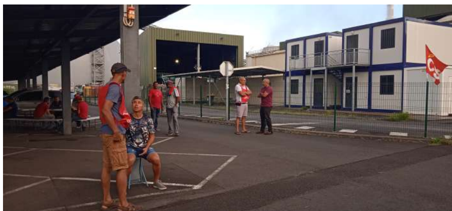
Les ouvriers de l'usine d'Albioma de St-André en grève le 22 mars

Immédiatement une campagne de dénigrement des grévistes, relayée par les médias, a consisté à accuser les grévistes de ces coupures, alors qu'ils n'y étaient pour rien, n'étant pas au travail !