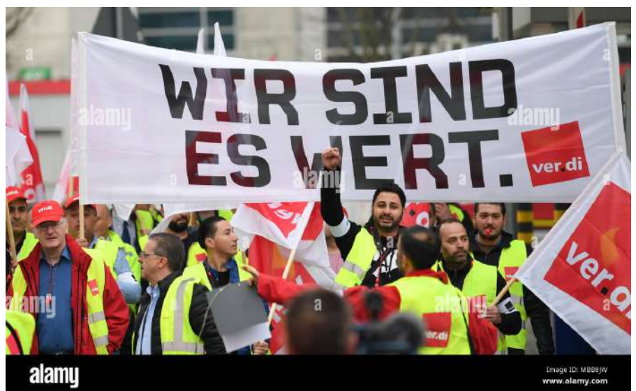
Travailleurs des services publics en grève avec leur slogan " Nous le méritons ! "

tières, qu'ils mènent une seule et même lutte contre leurs exploités !